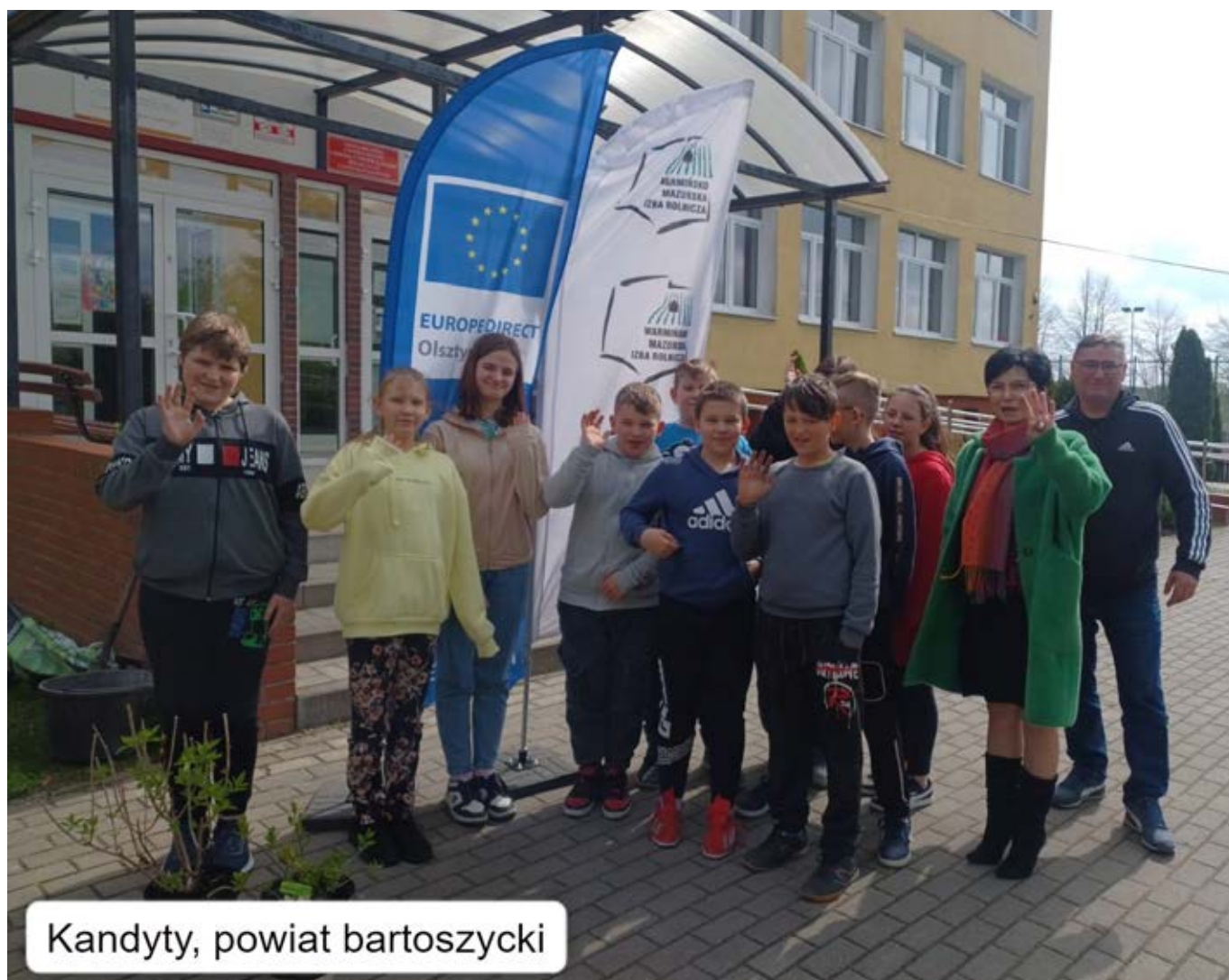
Kandyty, powiat bartoszycki

Wspólne sadzenie drzew i krzewów podkreśla naszą troskę o otaczającą przyrodę. Rośliny są nie tylko „zielonymi płucami” naszej planety, ale również prawdziwymi cudami natury, które wpływają korzystnie na ekosystem i jakość życia ludzi i zwierząt. Z tego też powodu zachęcamy wszystkich do przyłączenia się do tej akcji i podejmowania działań na rzecz ochrony naszego środowiska naturalnego. Każdy gest ma znaczenie, a razem możemy dokonać wielu pozytywnych zmian. ■