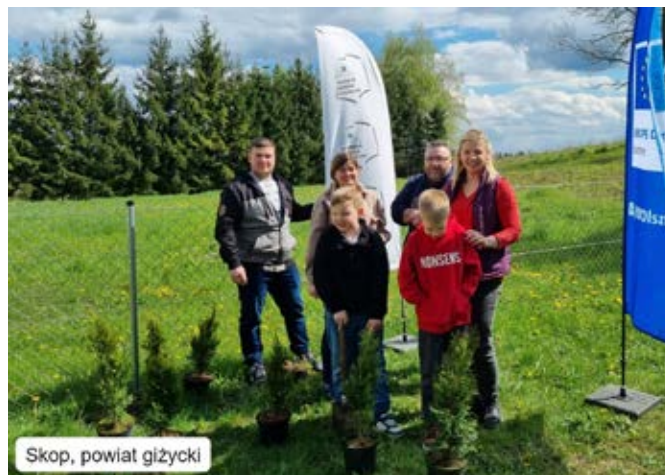
Skop, powiat giżycki