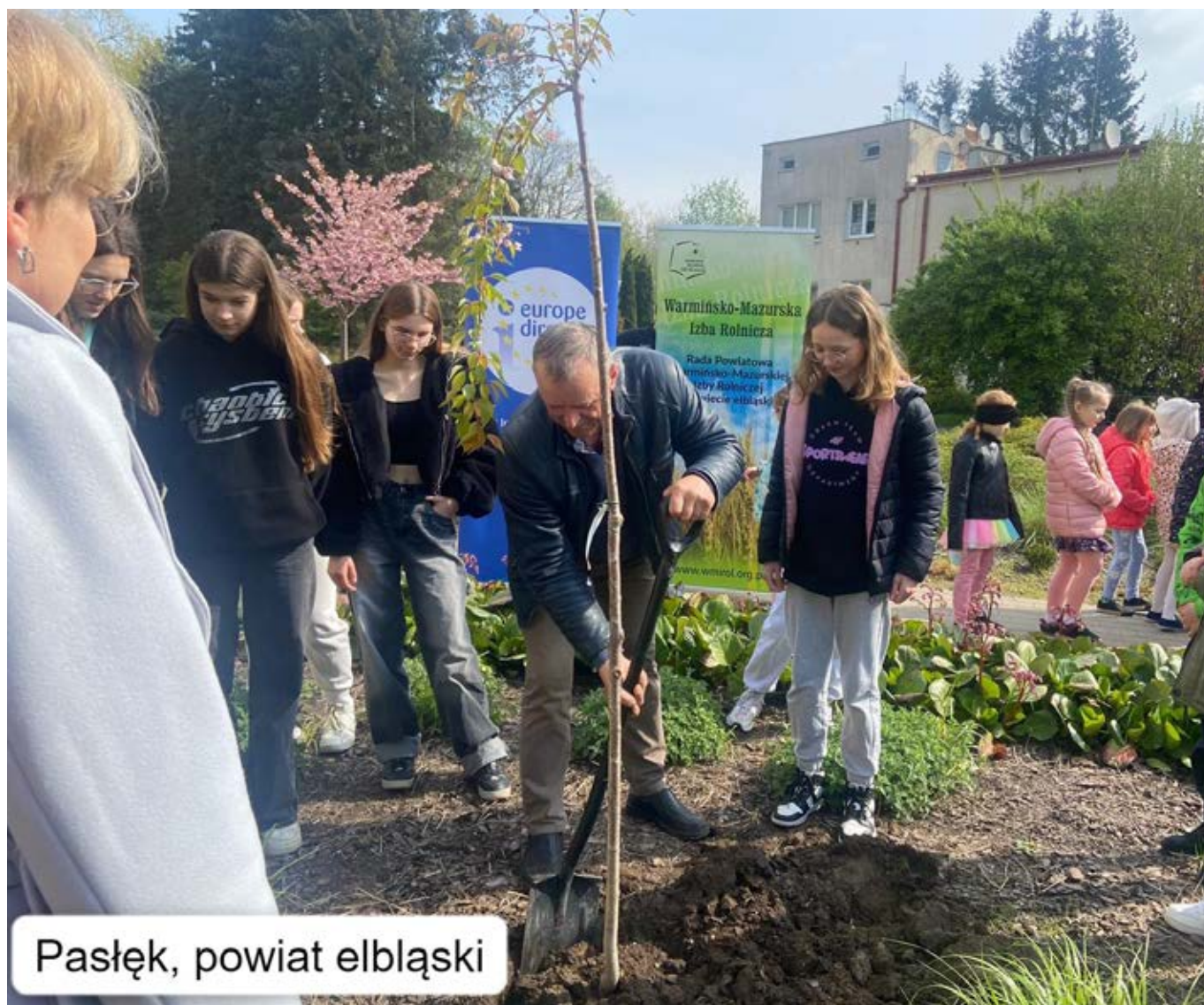
Pasłęk, powiat elbląski