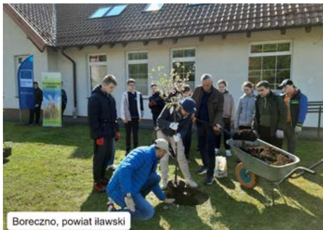
Boreczno, powiat ławski