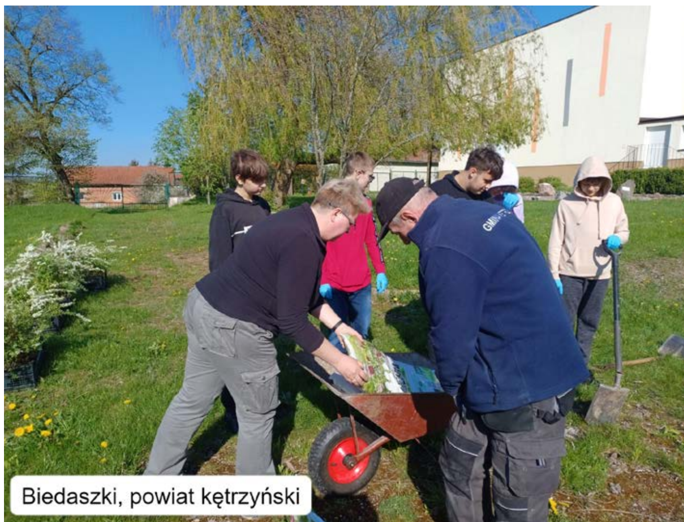
Biedaszki, powiat kętrzyński