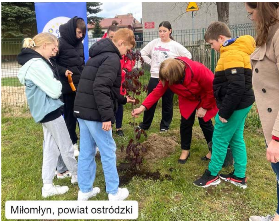
Miłomłyn, powiat ostródzki