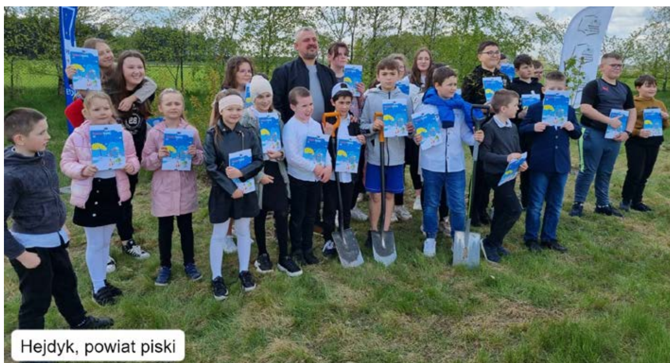
Hejdyk, powiat piski