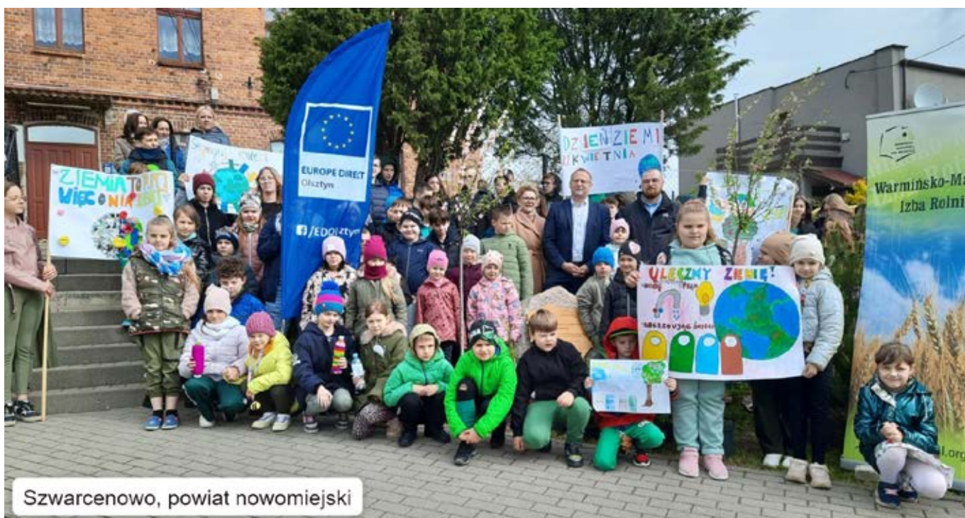
Szvarcenowo, powiat nowomiejski