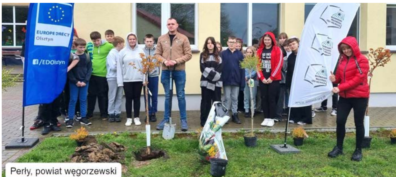
Perły, powiat węgorzewski