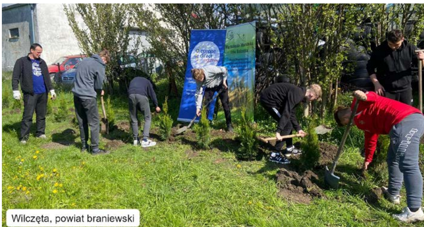
Wilczęta, powiat braniewski