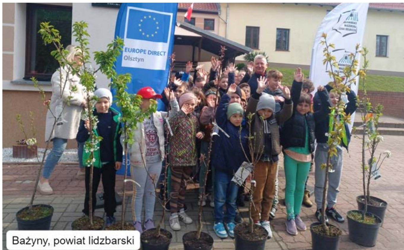
Bażyny, powiat lidzbarski