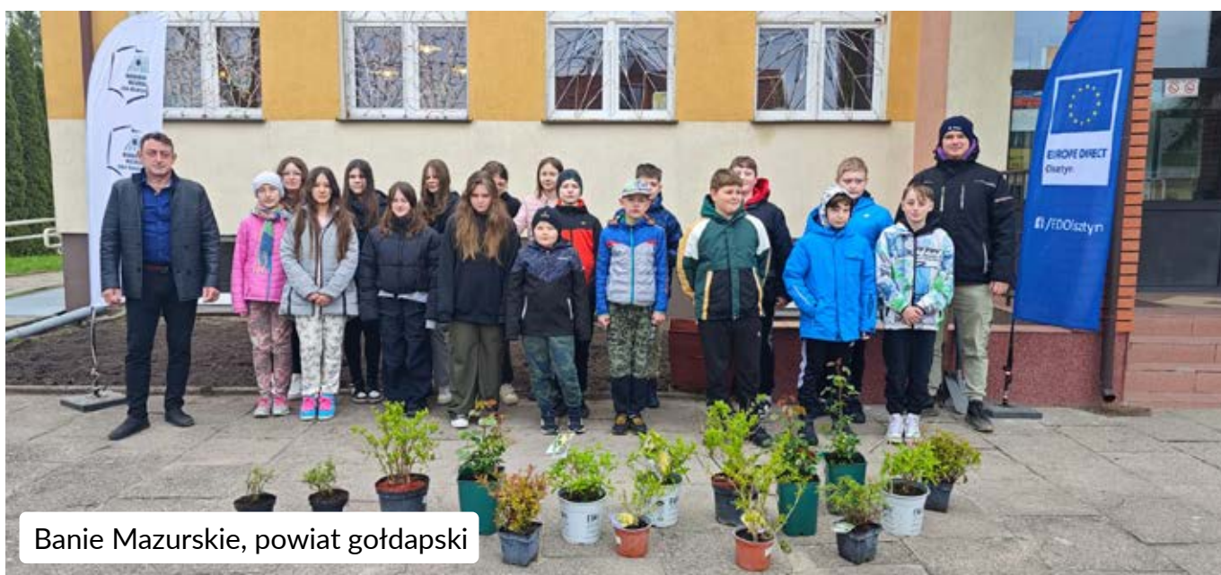
Banie Mazurskie, powiat gołdapski