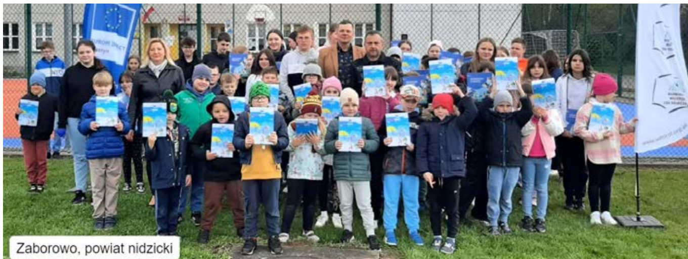
Zaborowo, powiat nidzicki